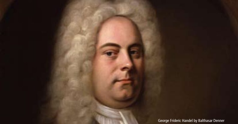
George Frideric Handel by Balthasar Denner