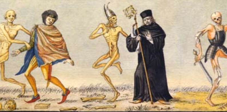
Danse Macabre of Basel, Johann Rudolf Feyerabend, 1806